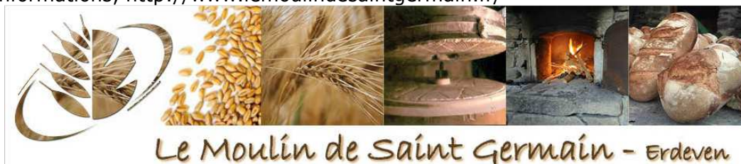
Le Moulin de Saint Germain - Erdeven

Pour plus d'informations, http://www.lemoulindesaintgermain.fr/